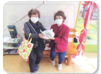
～沼津年金受給者協会清水支部～