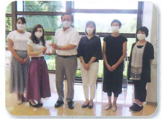
～清水町立幼稚園PTA連絡協議会～