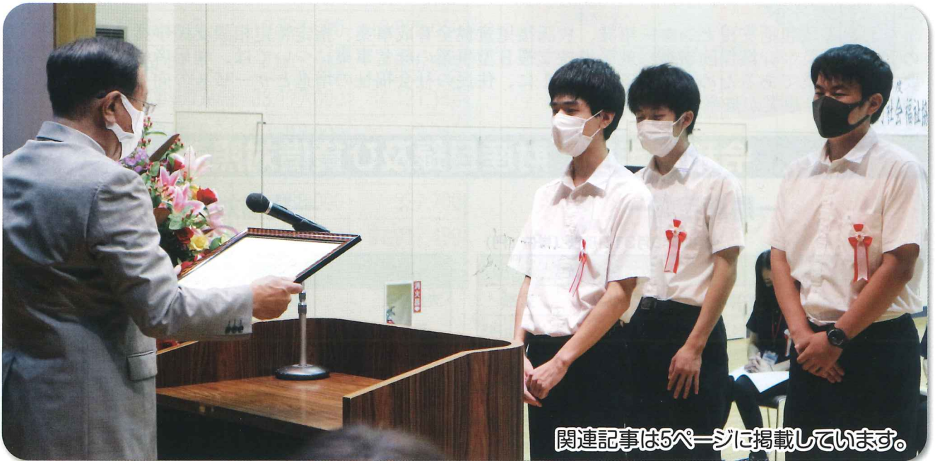
関連記事は5ページに掲載しています。