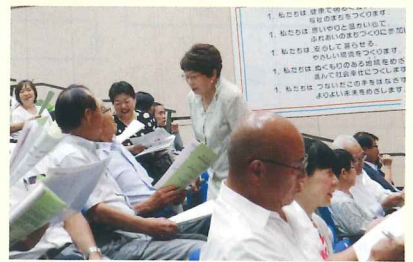
記念講演会の様子