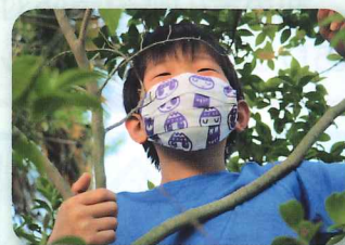
子ども用マスクもご用意しています。