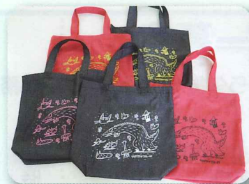
新しくトートバックを製作しました!