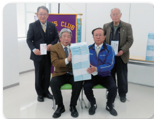
～清水町ライオンズクラブ～