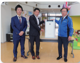
～静岡トヨタ自動車株式会社～