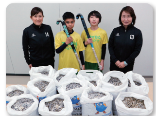
～清水町ホッケークラブ(SHC)～