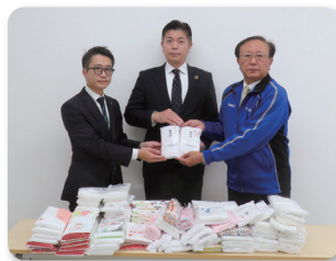
～第一生命保険株式会社～