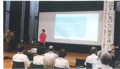
写真撮影時のみマスクを外しています。