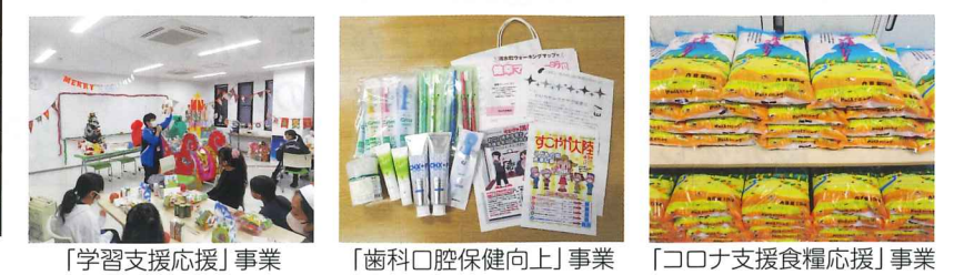
「学習支援応援」事業 「歯科口腔保健向上」事業 「コロナ支援食糧応援」事業

～赤い羽根共同募金からの助成金を、コロナ禍で生活に不便を感じている世帯への応援事業や災害用備品の購入費などに活用しました。～