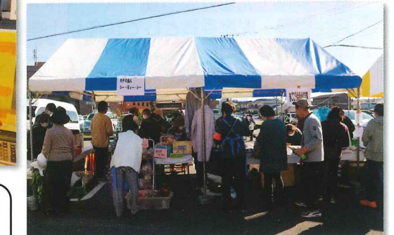
久しぶりに開催したイベントは、 大盛況でした。自主製品を知って いただく機会となりました。