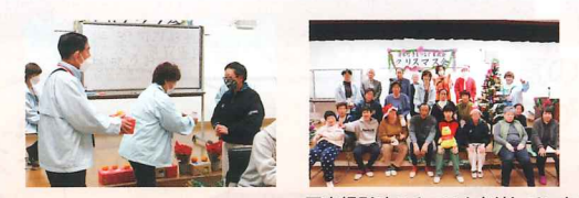
写真撮影時のみマスクを外しています。

3年ぶりにクリスマス会を開催しました。清水町民生委員児童委員協議会障がい者福祉部会の皆さまにご協力いただき、ポッチャゲームやビンゴ大会などを行い、たくさんの笑顔に囲まれ、楽しい一日となりました。