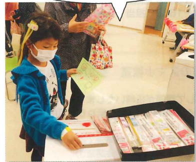
社会福祉協議会の事業紹介 赤い羽根共同募金への協力