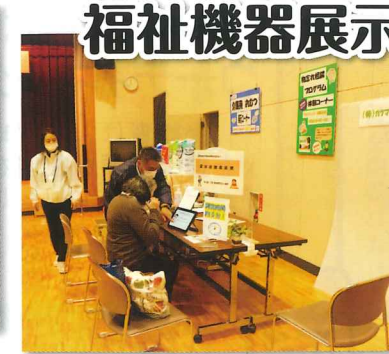
地域包括支援センター 民間事業所とコラボし、認知症の簡易検査・福祉用具の展示・AI歩行分析(動画で歩行状態が見える化)を行いました。また、健康相談や介護予防・高齢者の見守り支援について案内しました。