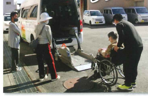
相談支援事業所ゆうすい 地域活動支援センター 事業所の案内や活動作品の展示 を行いました。