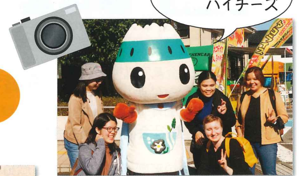
ゆうすいくんと笑顔で記念撮影