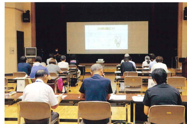
“生活支援サポーター養成講座の様子”

今後ちょっとしたお手伝いの輪が広がり、住民の皆様がお互い住みやすい町づくりを目指します。